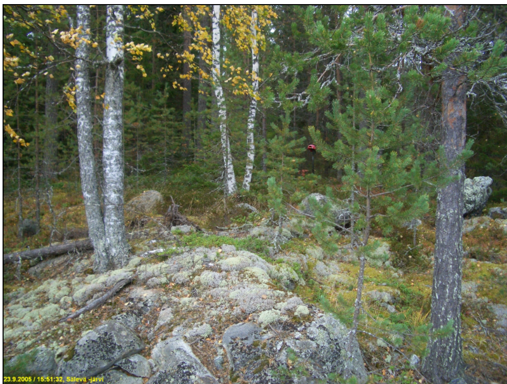
Asuinpaikkaa kuvattuna rantakalliolta koilliseen