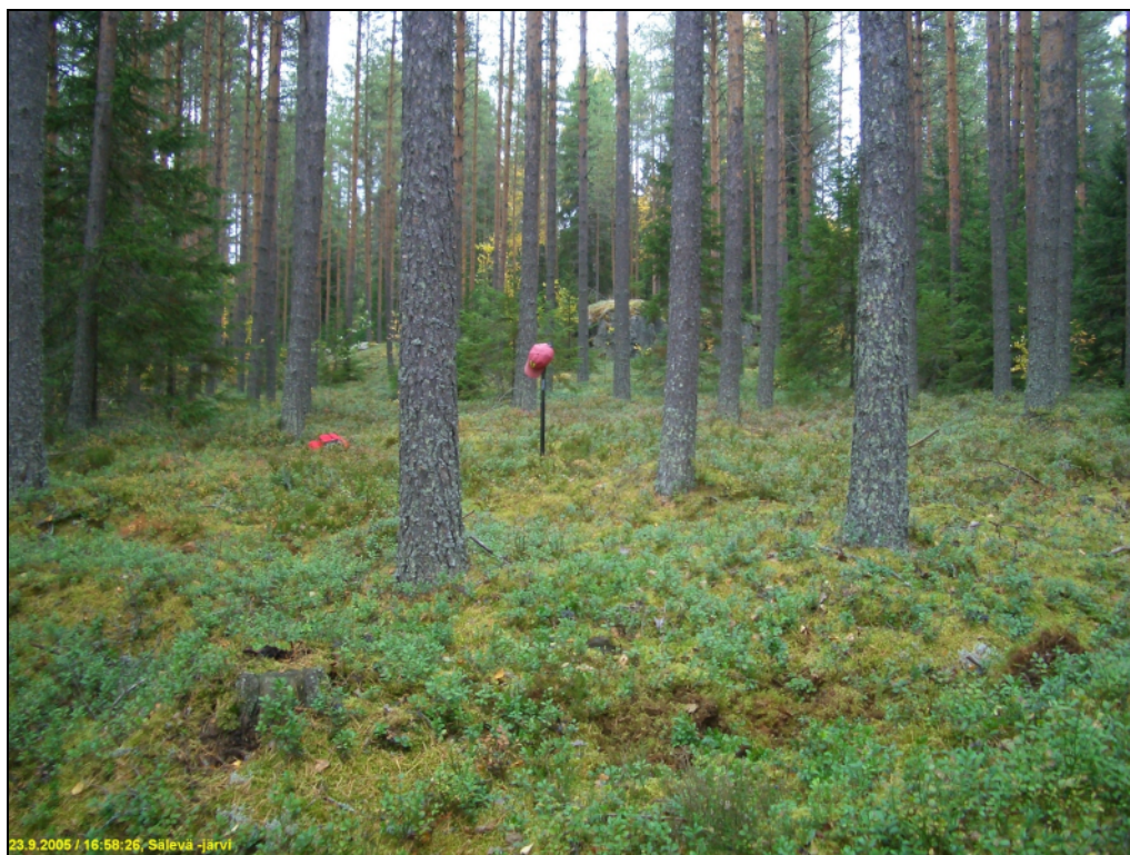
Asuinpaikan maastoa koilliseen, vasemmalla muinaisen rantatörmän reunaa, taustalla kalliota.