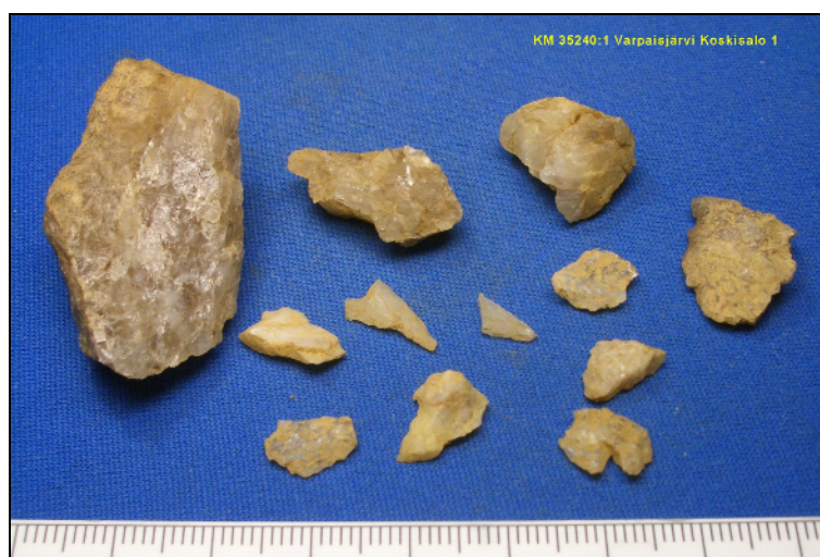
Yllä kvartsi-iskoksia ja alla palanutta luuta, koekuopista.