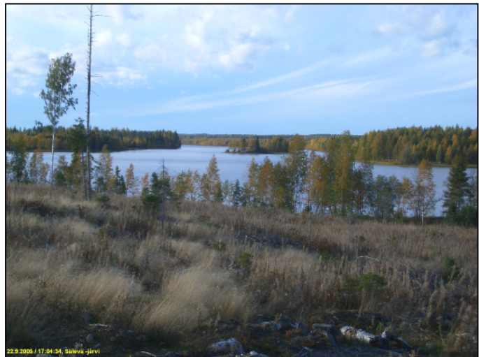
Heinittynyttä hakkuuaukkoa Siskonsalon pohjoispäässä. Kuvattu luoteeseen.

Asuinpaikalle suhteellisen (järven rantojen maaston mittapuun mukaan) sopivia suppea-alaisia maastonkohtia tuli vastaan harvakseltaan siellä täällä. Ainoa paikka mistä heti paikalle tullessani, jo ennen koekuopitusta saatoin todeta, että se on ”ehtaa asuinpaikkamaastoa” oli Koskisalo 2 –asuinpaikan kohdalla. Muut kaksi paikkaa tulivat lähes yllätyksenä, maakunnan mittapuun mukaan maasto niillä ei ollut mitenkään oivaa asuinpaikoille. Näistä tekijöistä johtuen kävelin järven rakentamattomat ja kuivemmat rannat varsin kattavasti läpi, harvakseltaan koepistoja tehden. Paikoin harpoin (sikäli kun sitä kivikossa voi harppomiseksi sanoa) rantakaistan nopeasti läpi tai tyydyin rantakaistan pistokoemaiseen lyhyeen tarkasteluun, paikoin kävelin koko rantakaistan huolellisesti muutama kilometrin matkalta. Pihamaita en tarkastanut. Moni mökki sijaitsee rantakaistansa parhaalla rakennuspaikalla, joka lienee yhtälailla ollut ”hyvä paikka” myös muinaisuudessa. Kyseessä oli – kuten lähes kaikkialla muuallakin Suomessa– ”räppiäiset” eli vielä säilyneiden muinaisjäänösten paikantaminen. Alueen pellot jäivät tarkastamatta, mutta mitenkään