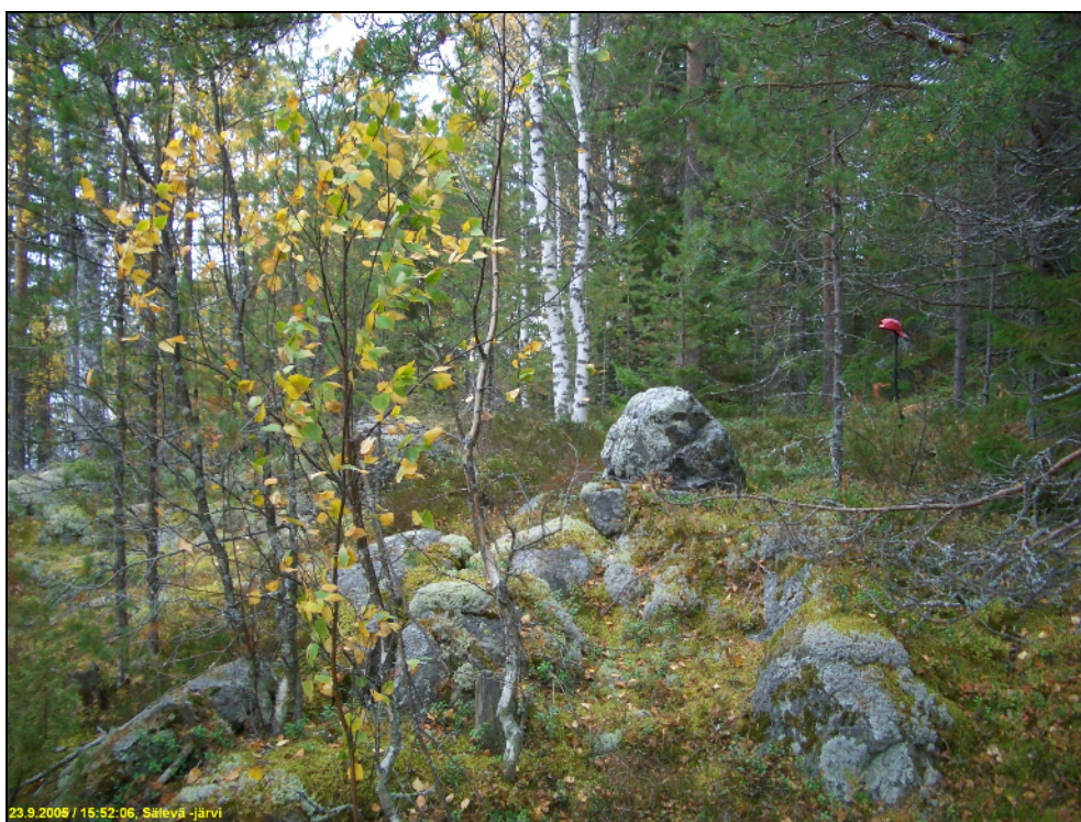
Asuinpaikan maastoa kuvattuna luoteeseen