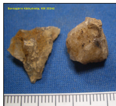
Palanutta luuta (vas.) ja kvartsi-iskos ja pieni loppuun isketty kvartsi-ydin