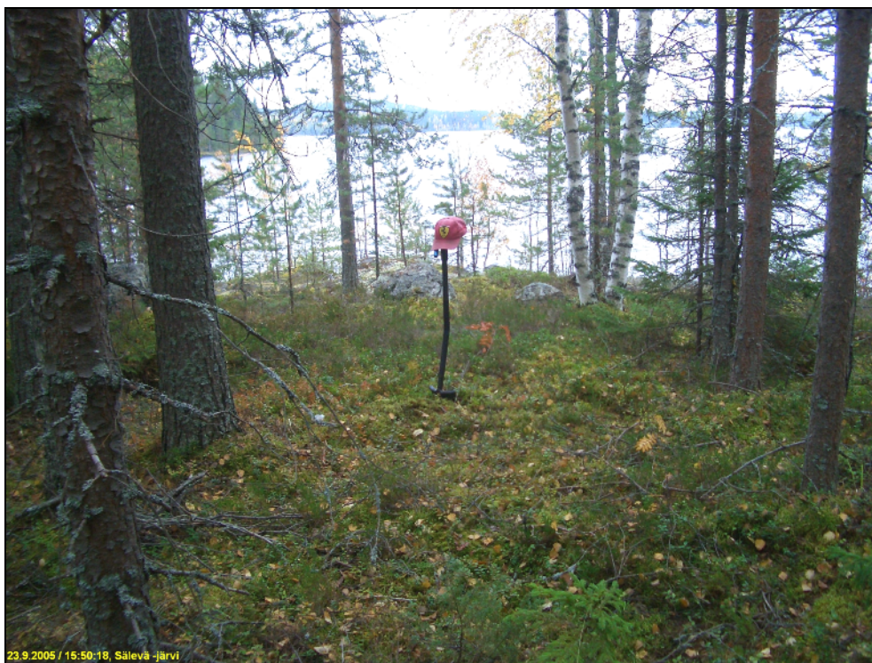
Asuinpaikan maastoa kuvattuna lounaaseen