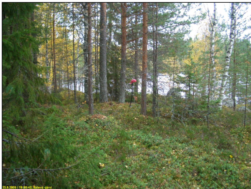
Asuinpaikan maastoa kuvattuna etelään.

Huomiot: Niemekkeessä, rantakallioiden päällä ja takana on ympäristöön verraten hieman vähäkivisempi ja hiekkaisempi maaperä. Maa on myös tasainen heti rantakallion takana ennen kuin se kauempana muuttuu normaaliksi alueella vallitsevaksi kivikoiseksi ja kalliomuhkuraiseksi maaksi. Paikalle tehdyssä parissa koekuopassa oli molemmissa muutama kvartseja, toisessa vahva kulttuurimaa, jossa runsaasti palaneen luun murusia. paikan rajausarvio perustuu suureksi osaksi topografiaan ja osin koekuopitukseen. Paikka on täysin ehjä ja kajoamaton ja siten suhteellisen arvokas muinaisjäännös.