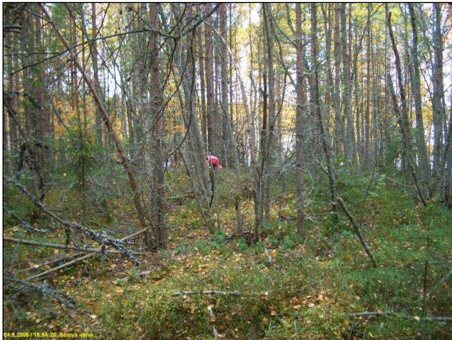
Asuinpaikan maastoa kuvattuna luoteeseen

Huomiot: Paikalla on järven rannassa tasalakinen kumpare, jonka pohjoisosassa järveen ja lännessä suohon laskeva rinne on jyrkempi. Kumpareen eteläosassa laki viettää etelään ja rinteet loivenevat kunnes maasto on tasaista. Maaperä paikalla on moreeni, kohtalaisen kivinen. Kumpareen laen pohjoisosassa pintamaaperän kivisyys on vähäisempää kuin etelämpänä ja rannoilla. Laelle, kumpareen pohjoisosaan tehdyssä koekuopassa oli vahva likamaa (n. 15 cm paksu) ja siinä runsaasti pientä palaneen luun murusta. Asuinpaikan rajausarvio perustuu topografiaan ja muutamiin koekuoppiin. Asuinpaikka on täysin ehjä ja kajoamaton ja siten suhteellisen arvokas muinaijännös.