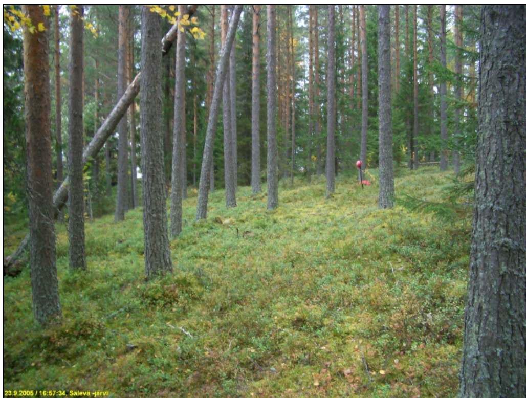
Asuinpaikan maastoa pohjoiseen.