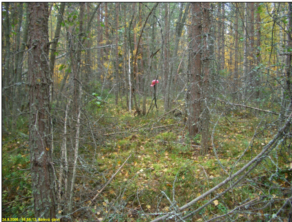
Asuinpaikan maastoa kuvattuna etelään