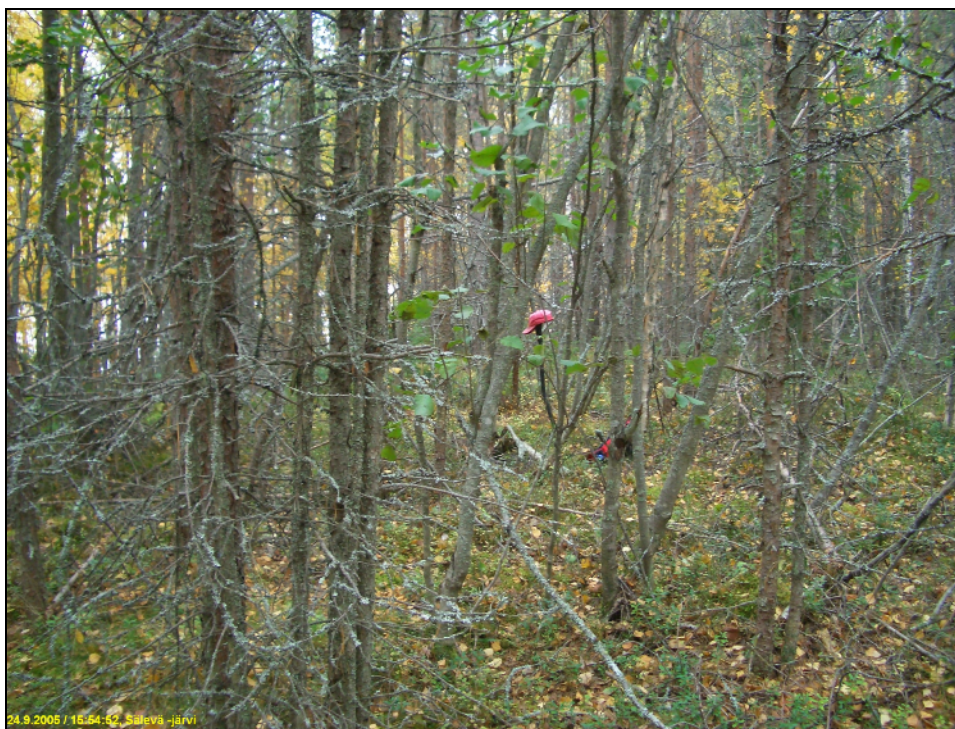
Asuinpaikan maastoa kuvattuna kaakkoon